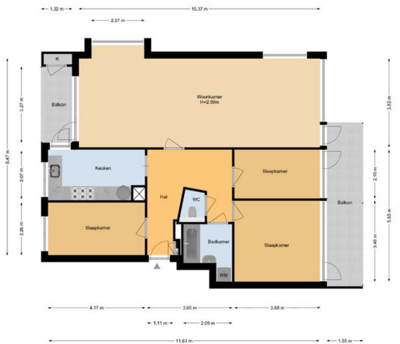
Jacob van Campenlaan 60 | Leiden 6e Etage

De plattegronden zijn geproduceerd voor promotionele doeleinden en ter indicatie. Aan de plattegronden kunnen geen rechten worden ontleend. www.woonkeur365.nl