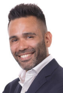
Cesar van Vliet Makelaar o.z.

Als lokale experts kennen wij de regio Leiden van binnen en buiten. U kunt bij ons terecht voor al uw vragen en advies met betrekking tot onroerend goed. Wij zijn een servicegerichte organisatie en ondersteunen u bij elke stap van het transactieproces. Van tips om uw huis verkoopklaar te maken tot aan het verzorgen van een naamplaatje voor de nieuwe eigenaar van uw woning. Onze beroemde slogan luidt: "Niemand in de wereld verkoopt meer onroerend goed dan RE/MAX." Laat ons u overtuigen.