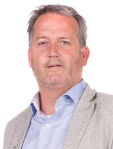
Andre Bunnig Makelaar o.z.

Als lokale experts kennen wij de regio Leiden van binnen en buiten. U kunt bij ons terecht voor al uw vragen en advies met betrekking tot onroerend goed. Wij zijn een servicegerichte organisatie en ondersteunen u bij elke stap van het transactieproces. Van tips om uw huis verkoopklaar te maken tot aan het verzorgen van een naamplaatje voor de nieuwe eigenaar van uw woning. Onze beroemde slogan luidt: "Niemand in de wereld verkoopt meer onroerend goed dan RE/MAX." Laat ons u overtuigen.